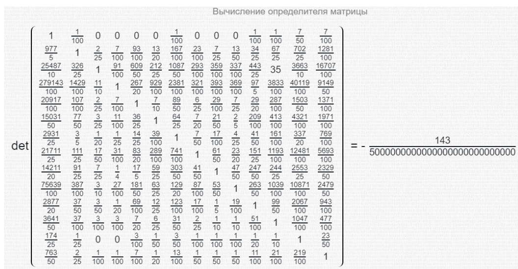
Рисунок 3 Результаты расчета определителя матрицы ООО «Лига Строй» 2020 г.