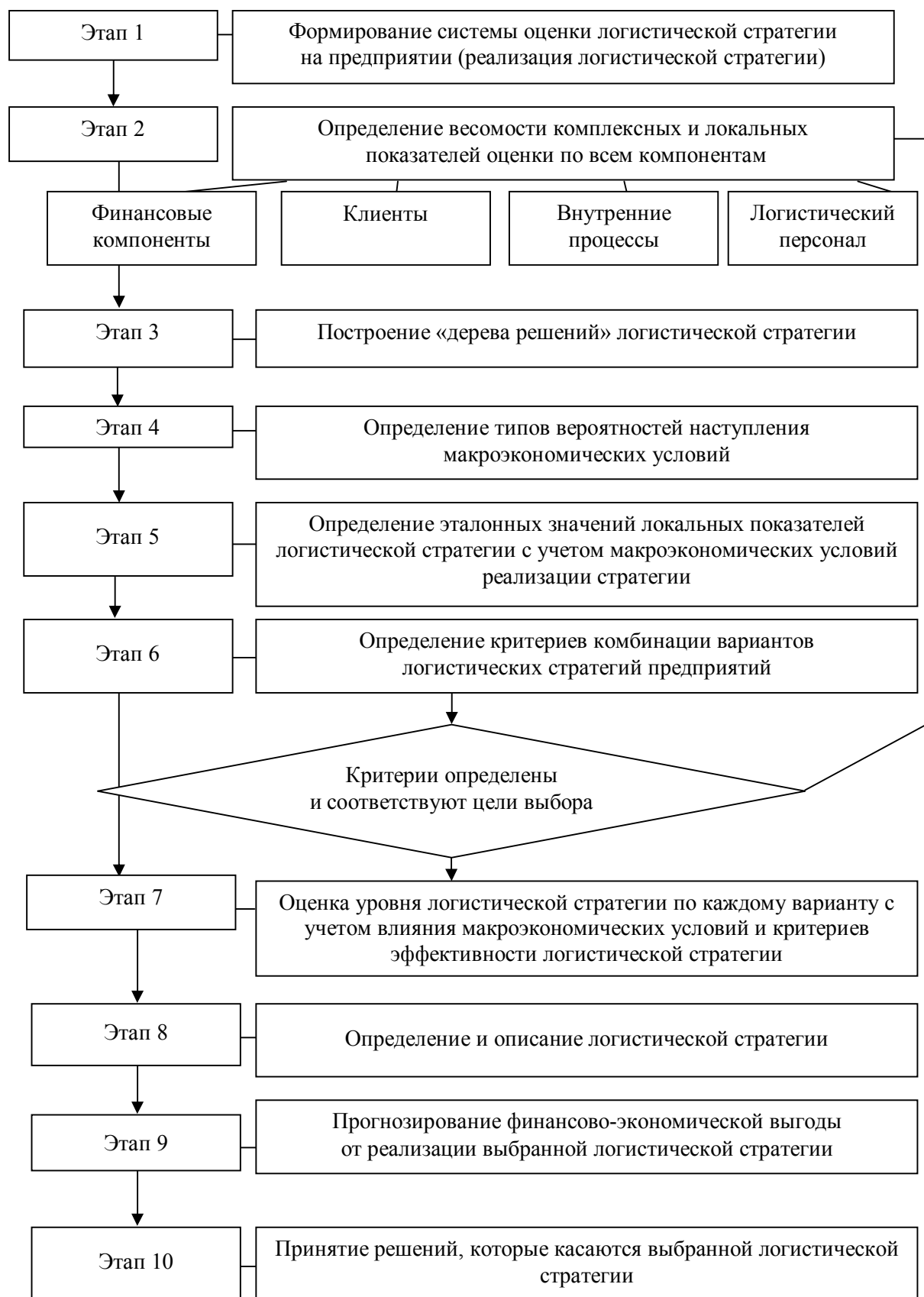
Рисунок 1 Процесс оптимизации выбора логистической стратегии предприятия