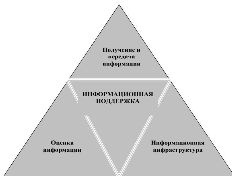
Рисунок 1 — Компоненты информационной поддержки (составлено автором)

– происходит оптимизация общего интеллектуального капитала предприятия — генерация новых знаний.