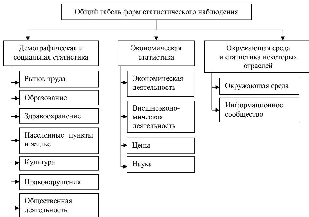
Рисунок 2 Структурно-логическая схема состава форм статистического наблюдения согласно приказу Госкомстата ЛНР

Реализация государственного статистического наблюдения в РФ возложена на Федеральную службу государственной статистики (далее — Росстат).