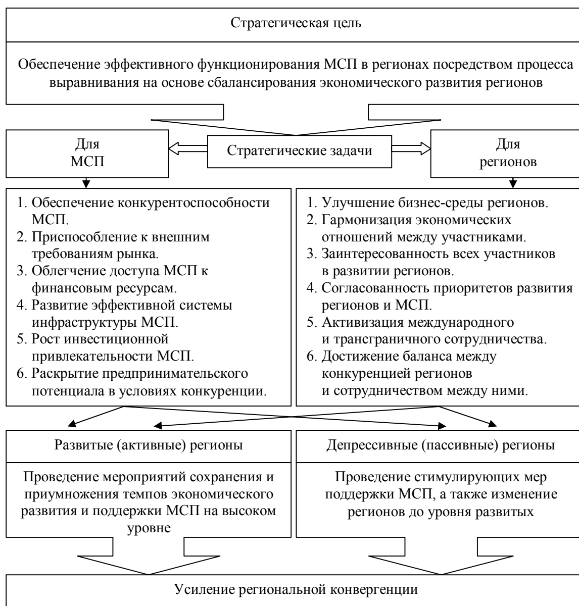
Рисунок 4 Концепция стратегических принципов выравнивания экономического развития МСП

Активные регионы занимают передовое место среди регионального распределения МСП по видам экономической деятельности. Преобладающей сферой экономической деятельности является промышленность.