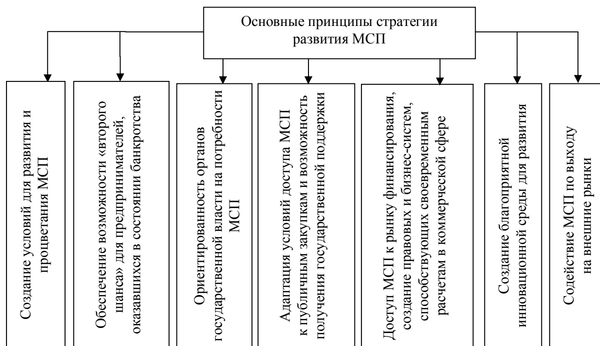
Рисунок 3 Основные принципы стратегии развития МСП