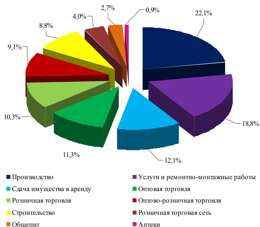
Рисунок 1 Структурное соотношение количества судебных дел на тему «фиктивного дробления бизнеса», которые были рассмотрены арбитражными судами РФ за период 2017–2019 гг.