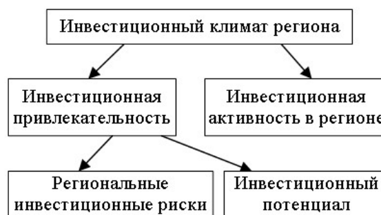
Рисунок 1 Структура инвестиционного климата региона

Основной материал исследования. Система формирования инвестиционного климата включает в себя структуру факторов, позволяющих определить условия процесса осуществления инвестиционной деятельности в регионе (рис. 1).