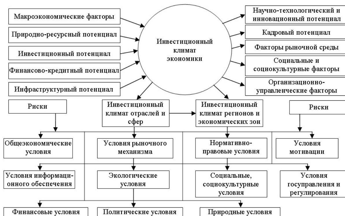
Рисунок 2 Структура инвестиционного климата и факторы его формирования

Взяв за основу институциональные методы оценки инвестиционного климата, позволяет определить расширенную структуру и факторы формирования инвестиционного климата (рис. 2).