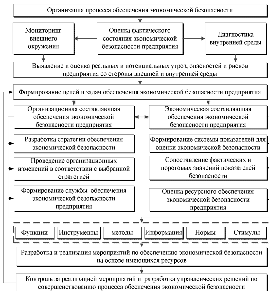
Рисунок 1 Алгоритм организационно-экономического механизма обеспечения экономической безопасности предприятия

Организационная составляющая предусматривает разработку соответствующей стратегии обеспечения экономической безопасности, проведение изменений и формирование структуры предприятия в соответствии с выбранной стратегией. При этом в структуре предприятия, в зависимости от сложности решаемых задач и его масштабов, формируется структурное подразделение, отвечающее за экономическую безопасность. Экономическая составляющая осуществляет экономическую